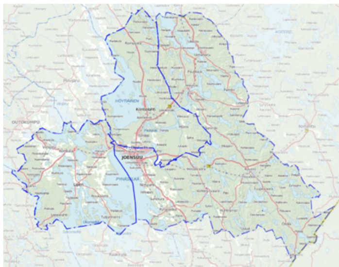
Kuva 1: Joensuun toimivaltainen viranomainen

Joensuun kaupungin toimivalta-alue käsitti vuonna 2018 Joensuun kaupungin sekä Kontiolahden ja Liperin kunnan alueet. Toimivaltaisena viranomaisena muulla seudulla ja toimivalta-alueen rajat ylittävässä liikenteessä toimi Pohjois-Savon elinkeino-, liikenne- ja ympäristökeskus (Liikenne ja infrastruktuuri).