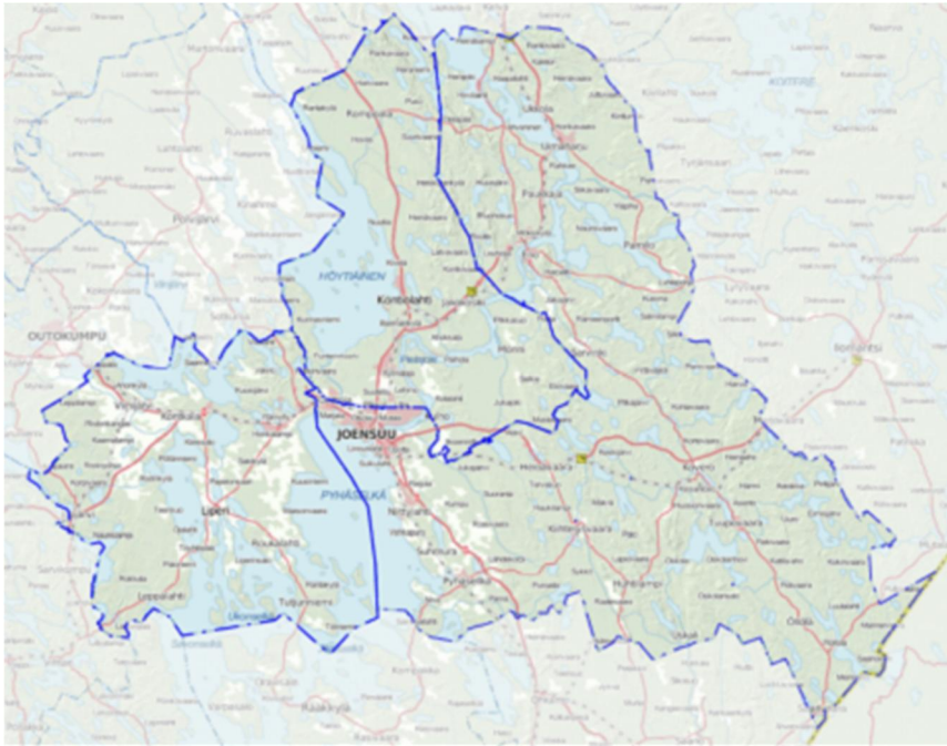
Kuva 1: Joensuun toimivaltainen viranomaisen